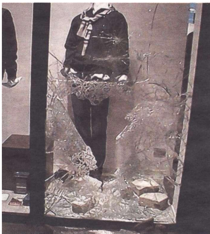
De ramkrakers lieten een spoor van vernieling achter bij kledingzaak Crusenmeyer.

Intens onderzoek en speurwerk van de politiezone Deinze-Zulte leidde vorige week naar een dievenbende uit Deinze en Aalter. Bij huiszoekingen stootten de agenten op een gedeelte van de buit. Drie volwassenen en een minderjarige werden opgepakt. De jongere uit Deinze werd door de